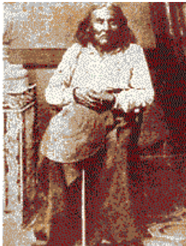
Seattle Jefe de los Suquamish y los Duwamish Nacido en 1786 Muerto el 7 de junio de 1866.

Mis palabras son como las estrellas: eternas, nunca se extinguen. Tenéis que saber que cada trozo de esta tierra es sagrada para mi pueblo. Cada aguja de un abeto, cada playa de arena, cada niebla en la profundidad de los bosques, cada claro entre los árboles, cada insecto que zumba es sagrado para el pensar y sentir de mi pueblo. La savia que sube por los árboles es sagrada experiencia y memoria de mi gente.