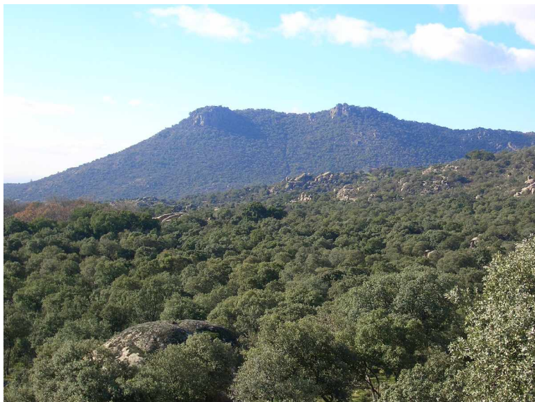
Vista de los Picazos desde el monte Egido

La ruta circular de Hoyo de Manzanares es la única ruta que se encuentra señalizada. Se inicia subiendo desde la Plaza de Toros por la calle Camino de Villalba, pasando por las entradas de las urbanizaciones El Picazo y más tarde El Roquedal, hasta el final de la calle de Prado Cerbuno donde existe una caseta de madera abierta. Se toma el camino a la derecha de la caseta y se sigue el mismo siguiendo las indicaciones que se encontrarán a lo largo de la vereda. Durante un buen trecho se bordea la Sierra de Hoyo a la izquierda. Desde aquí hay una buena vista de Los Picazos (Peña Alonso y Peña del Búho) el Cancho de la Parra (o la Tortuga), y el punto más alto de la Sierra, el Estepar (o la Mira), con 1.402 m. Si se contempla el paisaje que queda a la derecha, se observa el monte de El Pardo y la ciudad de Madrid.