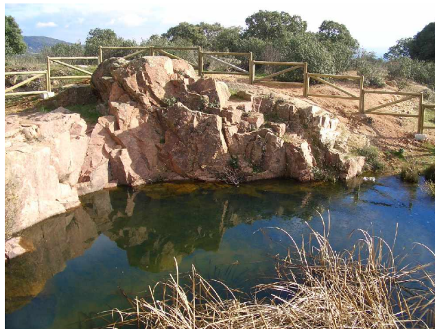
Cantera de Granito Rosa recientemente vallada

El Descansadero de la Praderuela es la entrada al Monte Egido y otro punto significativo en el trazado. Caminando por esta zona, se alza un soberbio ejemplar de alcornoque y unas amplias lanchas de piedra y otras canteras, actualmente valladas. La zona constituye un excelente mirador y una buena opción para hacer una parada. Las vistas desde este lugar son magníficas en cualquier dirección a la que se dirija la mirada. Hacia el sur se observa el monte de El Pardo y Madrid; girando hacia el este y si hay buena visibilidad, Fuencarral, San Sebastián de los Reyes, Tres Cantos, Colmenar Viejo... continuando el giro, y mucho más cerca, la Academia de Ingenieros y terreno militar. En el norte, el collado de la Torrecilla, donde la Sierra de Hoyo va decayendo en altura, y hacia el oeste se puede reconocer el resto de la sierra hasta terminar en los Picazos. Al suroeste en un alto se yergue el palacio del Canto del Pico, en Torreldones.